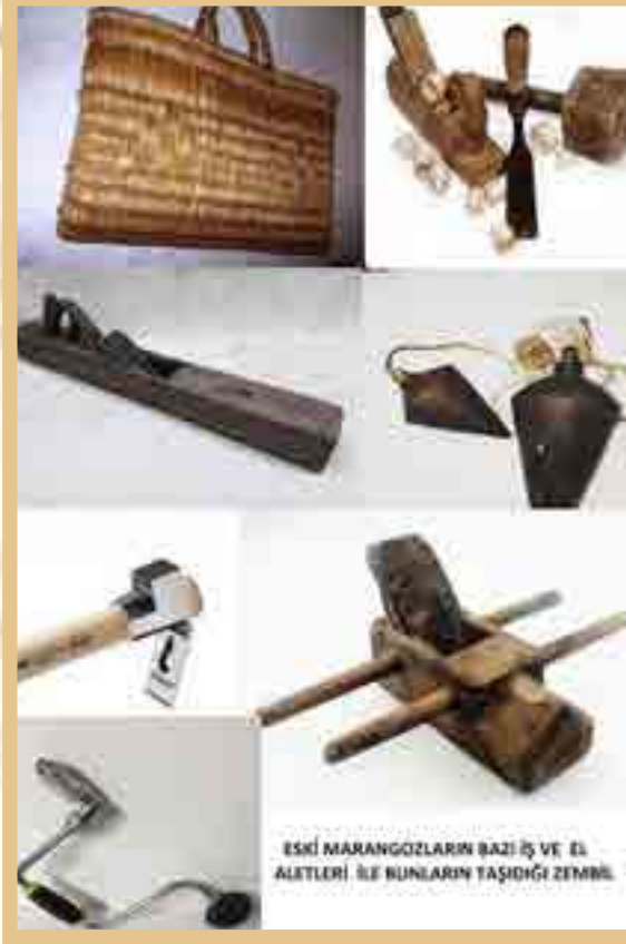
ESKİ MARANGOZLARIN BAZI İŞ VE EL ALETLERİ İLE BUNLARIN TAŞIDIĞI ZEMİN.

Ev yapmak için çok eski yıllarda gerekli ahşap malzeme balta ile yonulurdu. Ağaçları biçme işi daha iyi gelişmiş hızarlarla yapılmaya ve istenilen ebatta tahta ve kalas elde edilmeye başlandıktan sonra çok daha güzel binalar inşa olunmuştu. Bu evlerin pencereleri büyütülmüş, zaman içinde cam ve çerçeveye ulaşılmış, odalara yeni dolaplar ilave edilmiş, doğrama işlerine yenilikler getirilmiş, tavan süsleme işlerinde yeni yeni motiflere yer verilmişti. Ateş yakılan ocakların taş işçiliğinde de büyük gelişmeler olmuştu. Eski binalarda balkon yokken sonradan yapılanlara balkon ve cumbalar konmaya başlanmış, bazılarında oda sayısı üçe çıkarılmıştı.